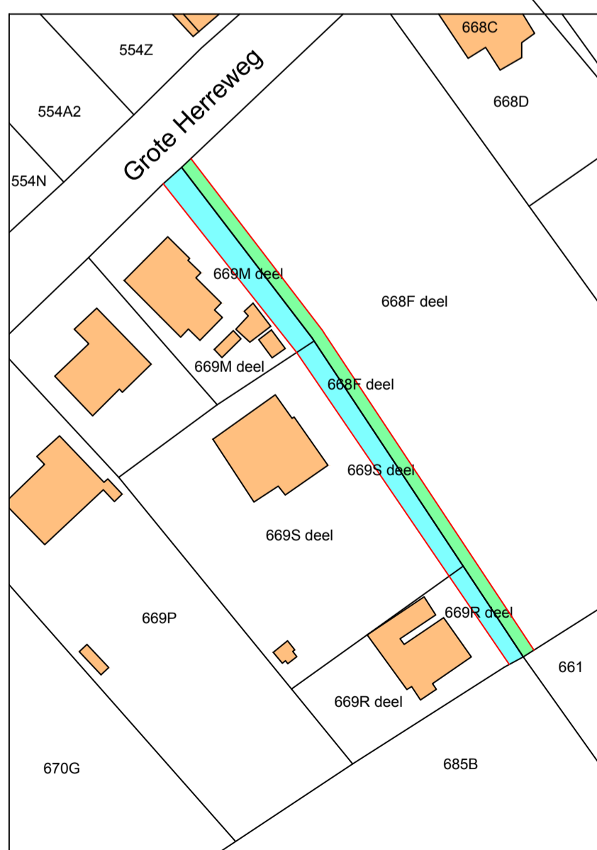
Situatieplan, schaal 1/1.000