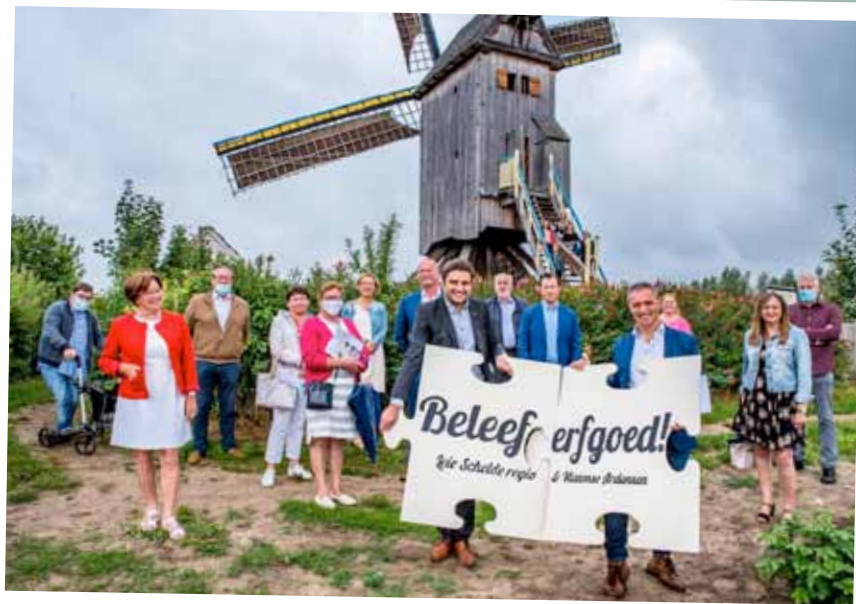
Persvoorstelling van beleef erfgoed.be aan Meuleken 't Dal in Zingem.

De twee regio's, verbonden door de Schelde, hebben een gelijkaardig DNA van landelijkheid, historische stedelijke kernen en rivieren. Beide worden sinds lange tijd gewaardeerd door kunstenaars op zoek naar rust en inspiratie.